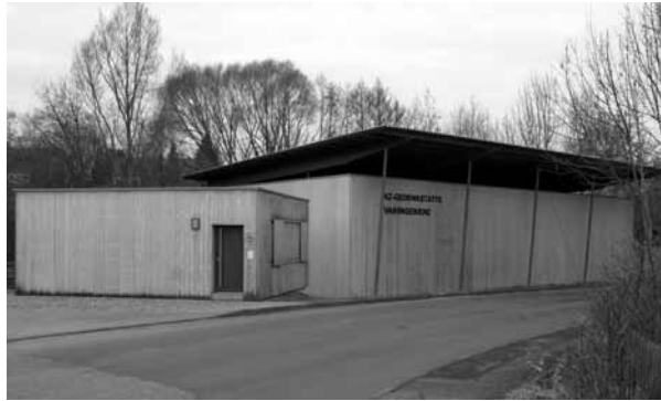
Die Gedenkstätte über den Fundamenten der ehemaligen Bade- und Entlausungsbaracke, daneben der Empfangs- und Informationsraum