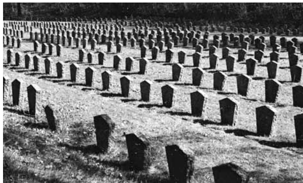
Der KZ-Friedhof, der Ort des Gedenkens. 1958 als letzte Ruhestätte für 1267 Opfer angelegt