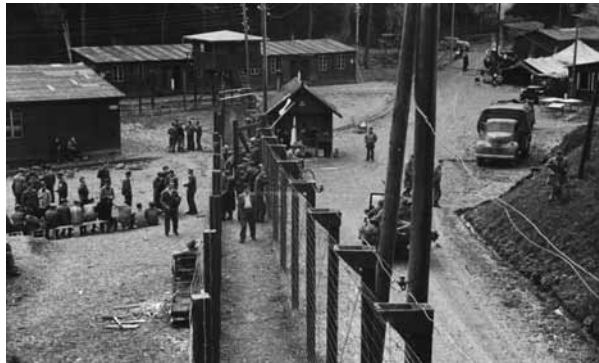
Das Lager wenige Tage nach der Befreiung. Im Hintergrund die ehemalige Kommandantur"